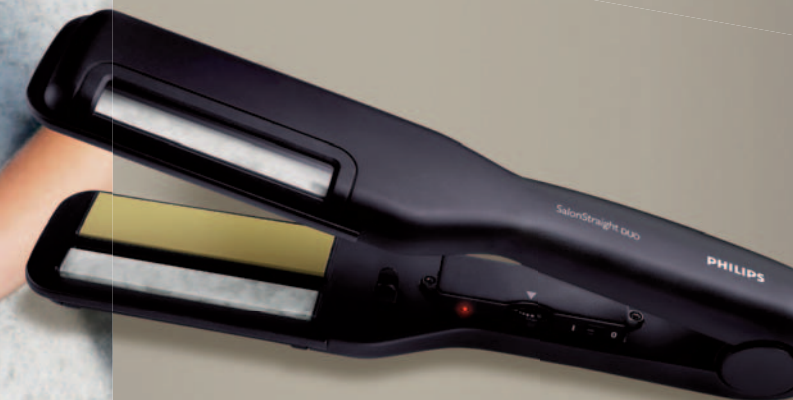
Philips Salon Straight Duo – två behandlingar i en.

Konsumentundersökningar visar att hela 89,3% av konsumenterna vill ha plattånger som ger ett perfekt resultat samtidigt som håret vårdas.